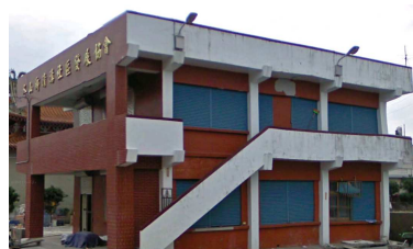
宜蘭縣政府消防局 105 年 07 月更新

清溝社區活動中心 面積：403.45 平方公尺 容納：85 人 地址：冬山鄉光明路 51 號 電話：03-9585809 適用災害類別：水災、震災、風災