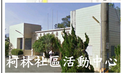
柯林社區活動中心

柯林社區活動中心 面積：256.2 平方公尺 容納：54 人 地址：光華路 209 號 電話：03-9517220 適用災害類別：水災、震災、風災